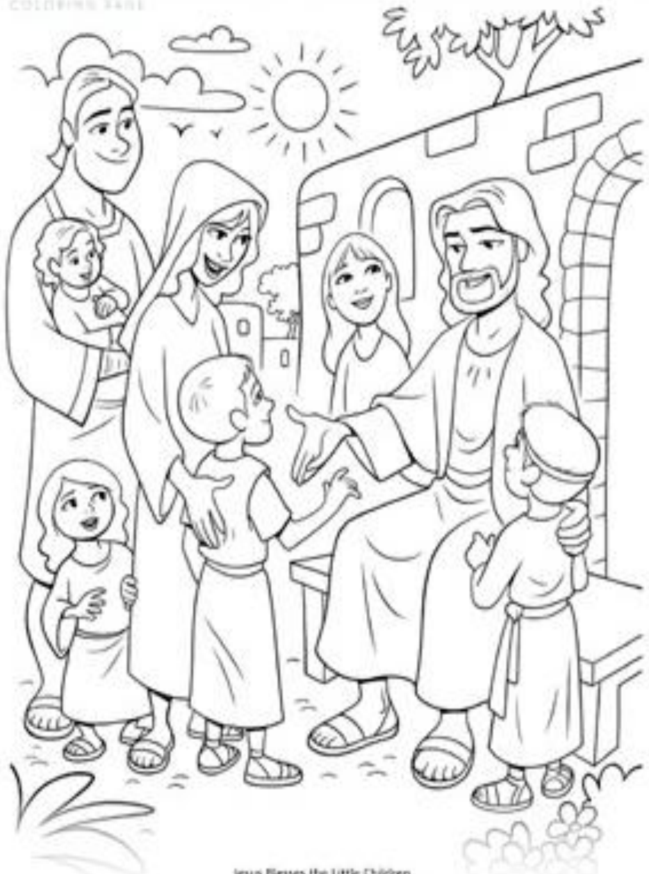
Jesus Blesses the Little Children

And he took them up on his arms, put his hands upon them, and blessed them (Mark 10:16).